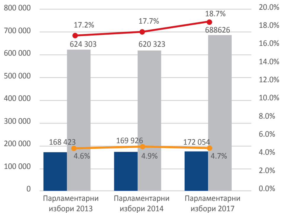
Фигура 1 Влияние на секциите в риск при ПИ 2013, 2014, 2017